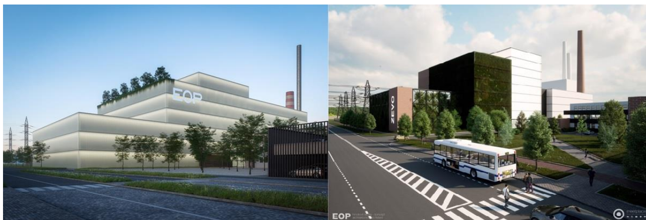
Návrhy vizualizací spalovny odpadů.

Elektrárny Opatovice, a.s. umístily nový záměr stavby u vjezdu do elektrárny, který již leží v katastru obce Čeperky. Nyní je stavba v souladu s územním plánem obce Čeperky. V současné době probíhá zpracování nového územního plánu obce Čeperky s možností dodatečné úpravy navrhované části územního plánu.